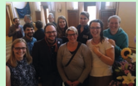
CSD-Empfang im Kieler Rathaus 2019 Bei allem Ernst unserer Anliegen sind wir auch 2019 in unserer Arbeit umwerfend charmant.

Sichtbar sein, sich einmischen, im Gespräch bleiben, Themen setzen, aufmerksam machen. Das gehört weiterhin zu unseren Kernaufgaben. Empfänge, Vorstragsveranstaltungen, Netzwerktreffen, Gremienarbeit bieten hierfür gute Gelegenheiten. Auch wenn unsere Kapazitäten in letzter gewachsen sind, können wir natürlich nicht immer und überall dabei sein. Aber präsenter als in den vergangenen Jahren ist die HAKI allemal und wir sind sehr zuversichtlich, dass das auch so bleibt - weil queere Stimmen in der Gesellschaft auch 2019 nichts an ihrer Relevanz verloren haben.