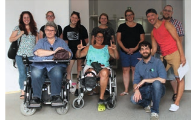
Oben: Einer der Gründe für ein neues HAKI-Zentrum war die Verbesserung der Barrierefreiheit. Hier ein Praxistest bei einem der ersten Besichtigungstermine.