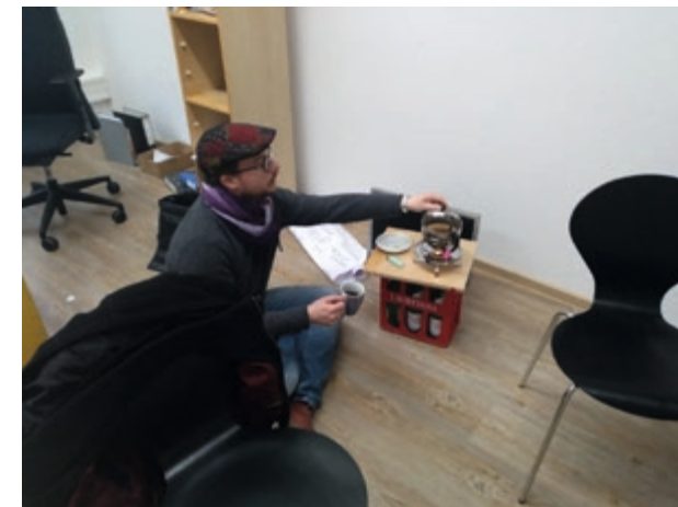
Oben: Das Arbeiten in den ersten Wochen nach dem Umzug waren noch geprägt von Campingcharme und Improvisation.

Kontakt: HAKI, Walkerdamm 17, 24103 Kiel Tel.: 0431 -17 090 Mail: post@haki-sh.de