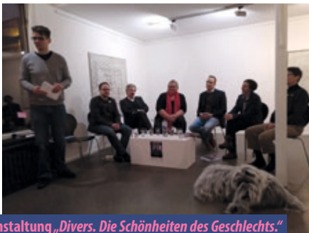
Veranstaltung „Divers. Die Schönheiten des Geschlechts.“ im Rahmen des Landesaktionsplans Echte Vielfalt

Viele Akteur*innen kommen in regelmäßigen Abständen am „Runden Tisch Echte Vielfalt“ zusammen. Dort tauschen wir uns über aktuelle Themen und Planungen zu Projekten aus. Es geht hierbei auch um die Projekte, die im Rahmen des Landesaktionsplans Echte Vielfalt mitfinanziert werden. Das Land stellt hierzu 60.000 Euro im Jahr zur Verfügung. Die Geschäftsstelle Echte Vielfalt unterstützt bei der Projektentwicklung, Durchführung und Abrechnung, die Treffen