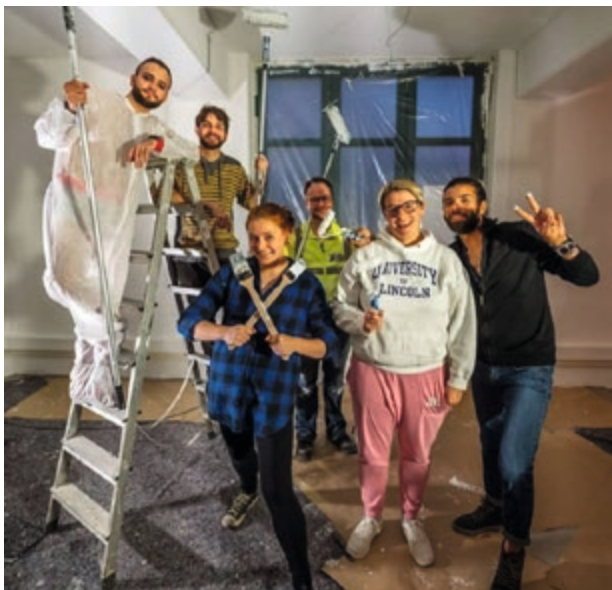
Oben: Im Umwerfend-Aussehen sind wir mindesten so gut wie im Renovieren!

Schon am 19.11.2018, zwei Tage nach dem Umzug, nahm das neue HAKI-Zentrum mit zwei parallelen Gruppentreffen seinen vollen Betrieb auf. Was früher eine ferne Vision war