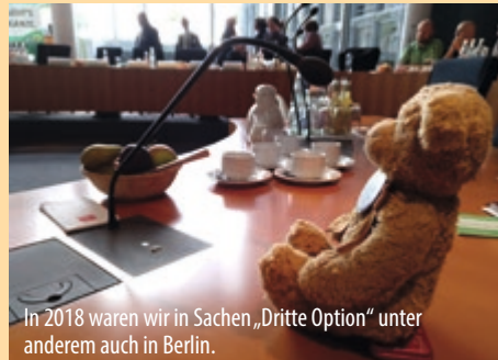
In 2018 waren wir in Sachen „Dritte Option“ unter anderem auch in Berlin.

Nach dem einschlägigen BVerfG-Beschluss, der die Bundesregierung aufforderte, das deutsche Recht um einen weiteren Personenstand zu ergänzen, war auch die HAKI bemüht, auf eine gute und inklusive Regelung hinzuwirken, möglicherweise sogar den „großen Wurf“ eines Selbstbestimmungsge-