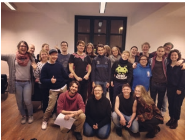
Oben: Gleich am ersten Tag nach dem Umzug war die Bude voll, wie hier beim Teamtreffen von SCHLAU Kiel

- konzentriertes Arbeiten im Büro, mehrere Gruppentreffen, Veranstaltungen plus Besucher*innen im HAKI-Zentrum gleichzeitig - ist Wirklichkeit geworden.