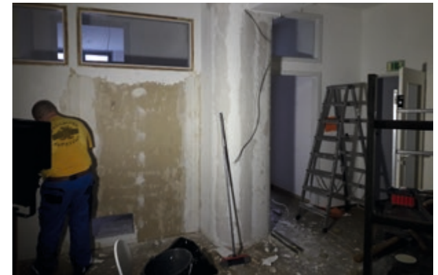
Oben: Keine Berge, aber immerhin Wände wurden bei den Renovierungsarbeiten versetzt.