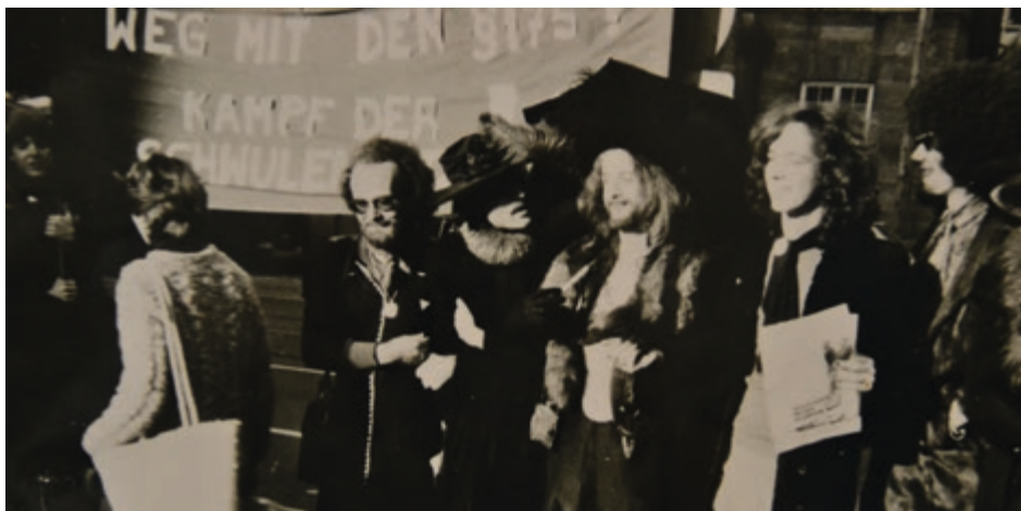
Auch in Kiel gründeten sich in den Jahren nach den Stonewallaufständen Protestbewegungen