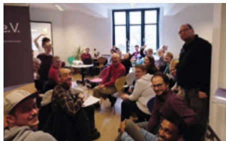
Oben: Mitgliederversammlung 2019

Am 30. März fand die ordentliche Mitgliederversammlung der HAKI statt - die erste im neuen Zentrum. Und weil der Umzug unserer Organisation vielleicht die nach außen sichtbarste, aber beileibe nicht die einzige Veränderung der letzten Monate und Jahre ist, waren Vorstand und Team der HAKI überaus glücklich, dass bei strahlendem Sonnenschein 47 Menschen ins Zentrum gekommen sind, um der MV beizuwohnen. Und vor allem, dass die Mitgliederversammlung den eingeschlagenen Kurs voll und ganz unterstützt. Die Entwicklungen speziell der letzten zwei Jahre bedeuten für alle Beteiligten eine große Herausforderung: Die Seele der HAKI